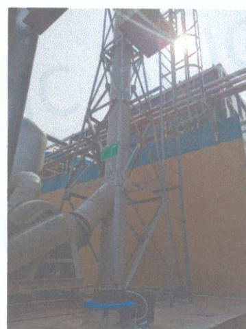
污水处理站排气筒出口 07#