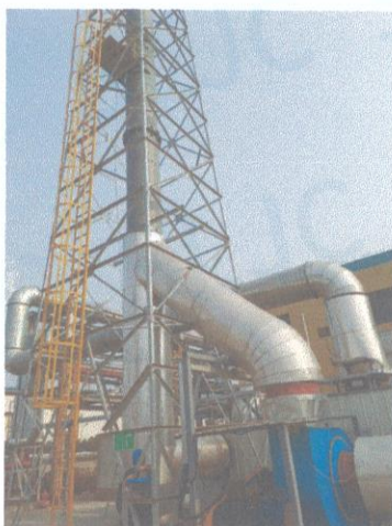
RTO 排气筒出口 06#