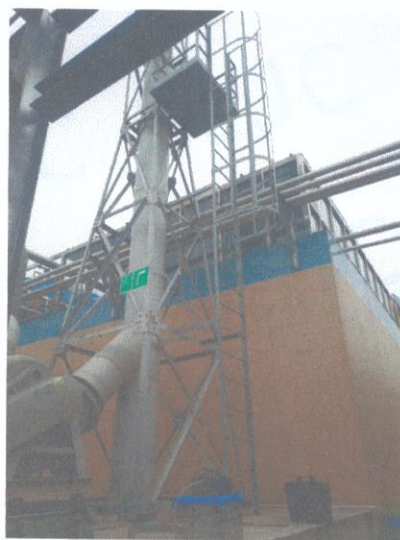
污水处理站排气筒出口 06#