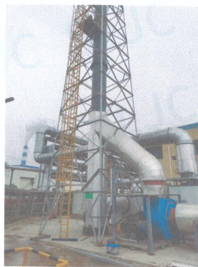
RTO 排气筒出口 05#