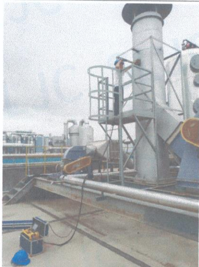
车间二排气筒出口 02#