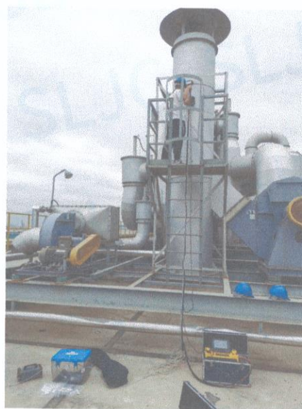
车间一排气筒出口 01#