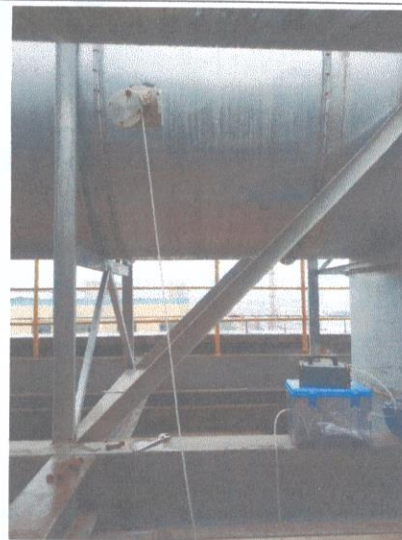
研发室排气筒出口 03#