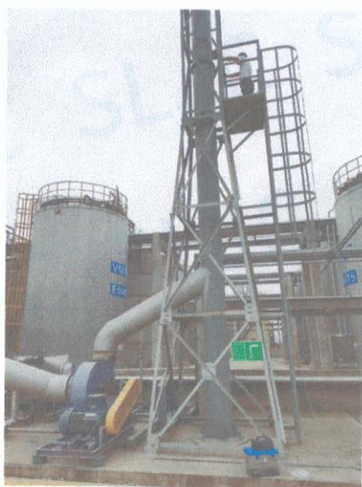
罐区一排气筒出口 04#