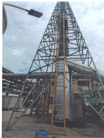
RTO 排气筒出口 06#