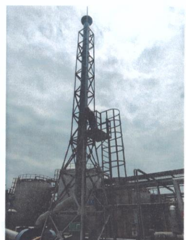
罐区一排气筒出口 05#