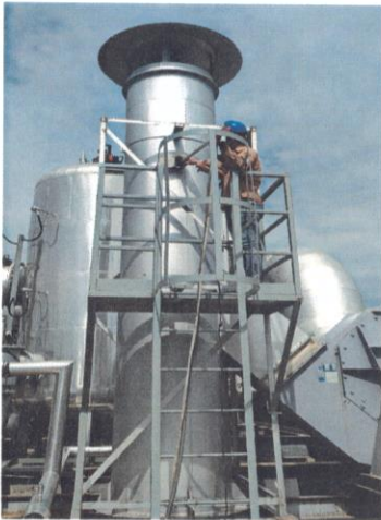
车间二排气筒出口 03#