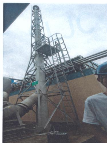
污水处理站排气筒出口 07#