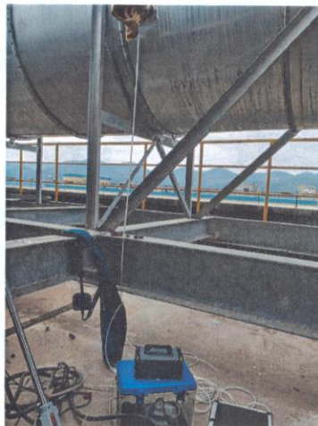
研究室排气筒出口 04#