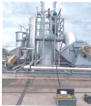
车间二排气筒出口 02#