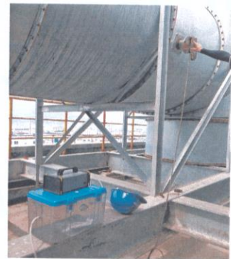
研发室排气筒出口 03#