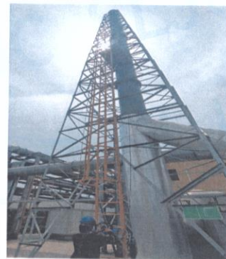
RTO 排气筒出口 07#