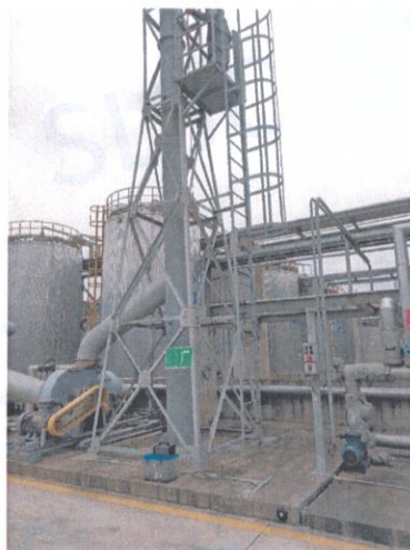
罐区一排气筒出口 04#