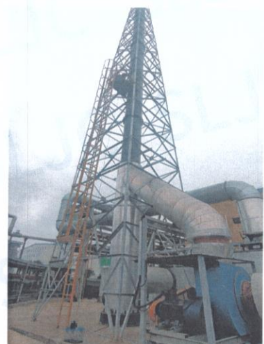
RTO 排气筒出口 05#