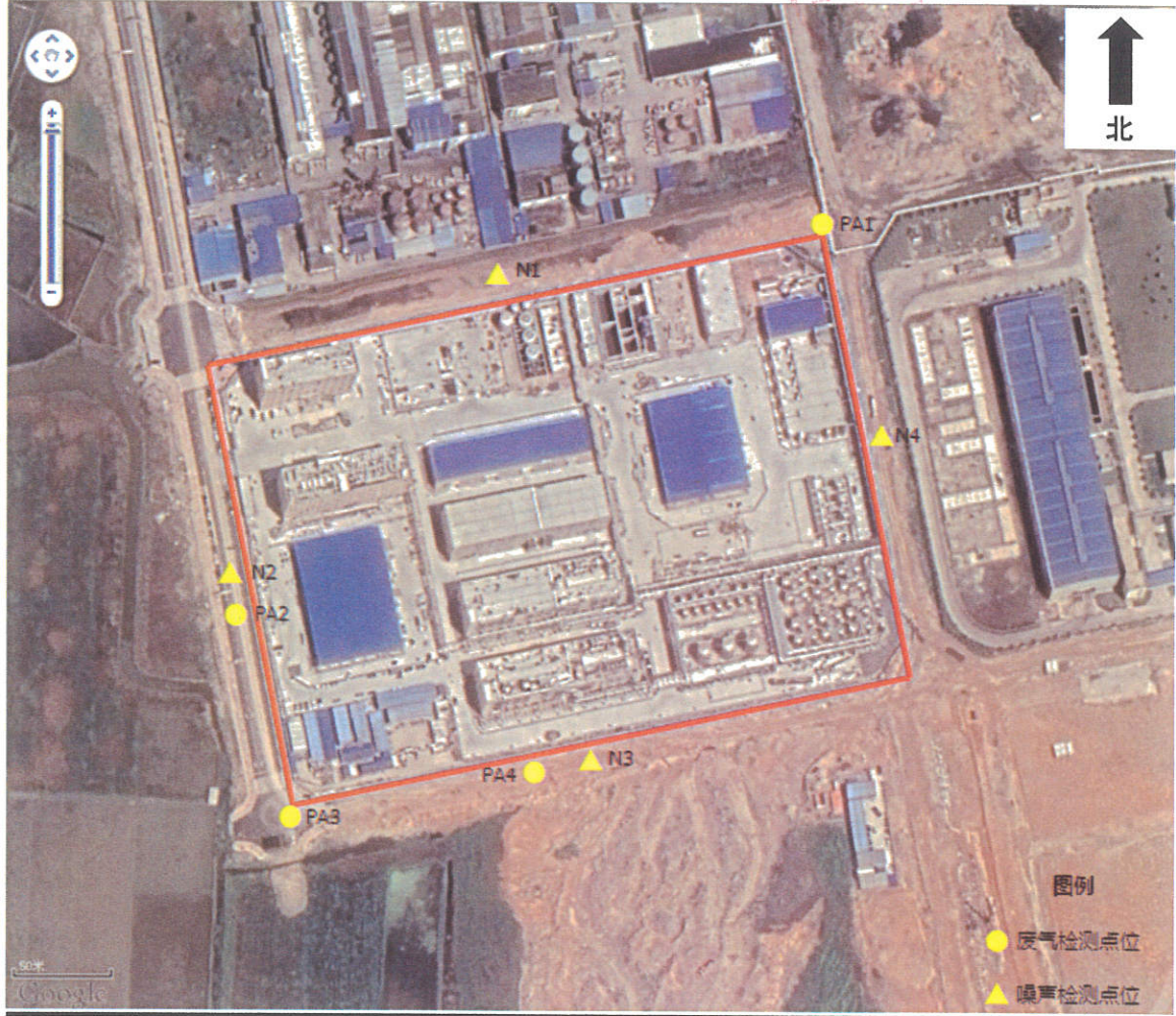
附图 1 检测点位图